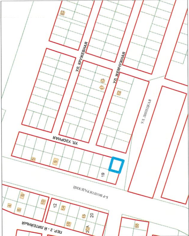
УЛИЦА ЛИПЕЦКАЯ сечение 147-1