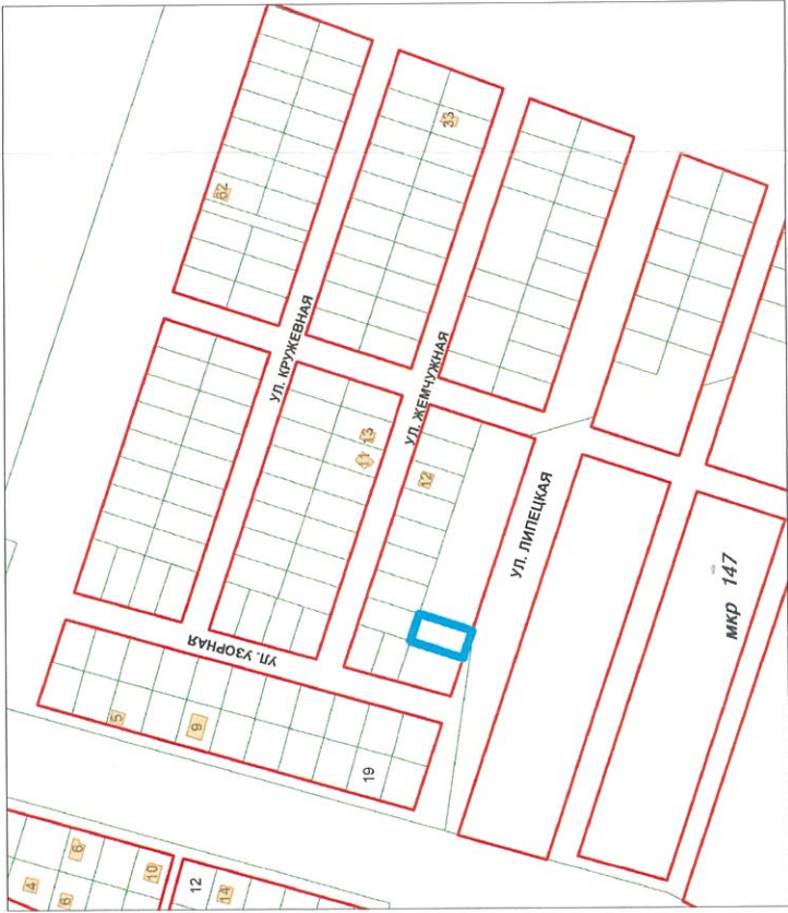
УЛИЦА ЛИПЕЦКАЯ сечение 147-1