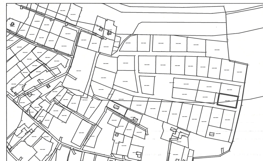
Схема расположения земельного участка с кадастровым номером: 35:22:0114025:851