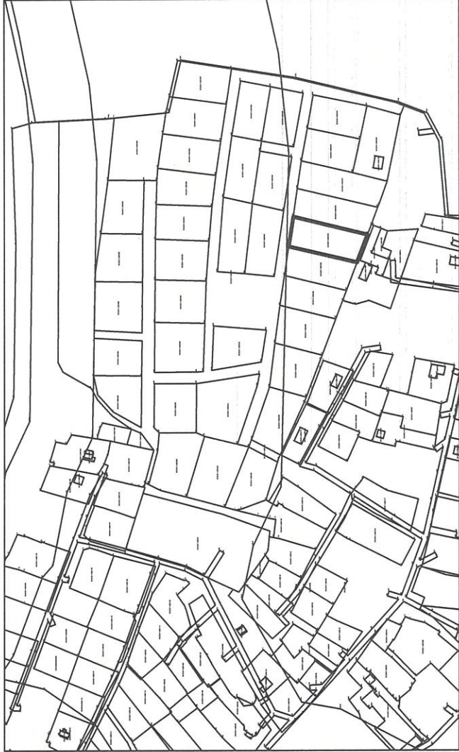
Схема расположения земельного участка с кадастровым номером: 35:22:0114025:819